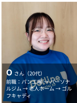
Oさん (20代) 前職：パン工場 → パーソナル ジム → 老人ホーム → ゴルフ キャディ

今回の転職で介護職を選んだ理由は、以前に老人ホームで勤務していた経験があったこと。そして、ゴルフ場でキャディとして働いていた際、高齢のお客様や足の悪いお客様をご案内する場面で介護の経験が活かされることがあり、「異業種でも活かしているなら、もっと介護について学びたい」と感じたためです。